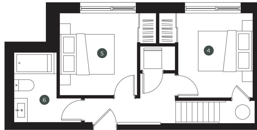
SOUS-SOL / BASEMENT

NOTE : Les superficies et dimensions sont approximatives et sujettes à des modifications sans préavis. La superficie brute des logements inclut à moitié des murs mitoyens et les murs extérieurs. Le mobilier et les électroménagers sont montrés à titre indicatif seulement.